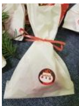
Geschenk-Tütchen für jedes Kind