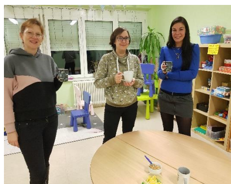
Zufriedene Wichtel nach getaner Arbeit