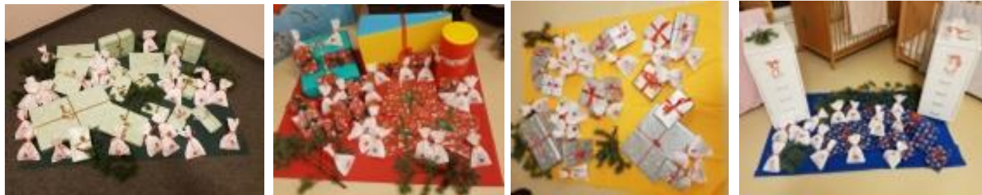
Geschenke für grüne, rote, gelbe und blaue Spatzen im kleinen grünen Haus

Förderverein Kita Spatzennest Rangsdorf e.V.